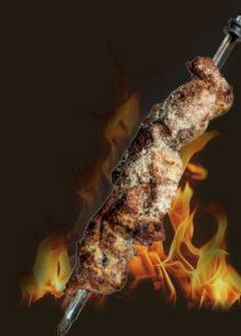
PORC AU PARMESAN