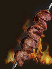
PICANHA SURLONGE DE BOEUF