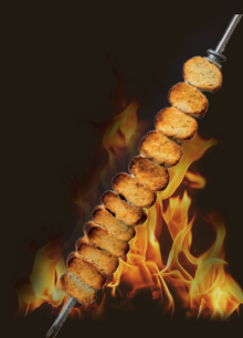
PAIN À L'AIL