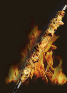
POULET À L'AIL