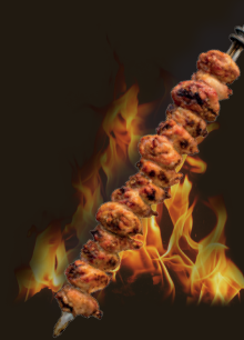
PILON DE POULET